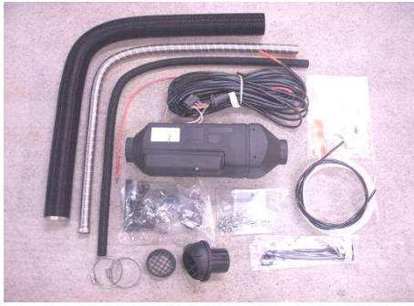
エアトニックB1LCセット内容