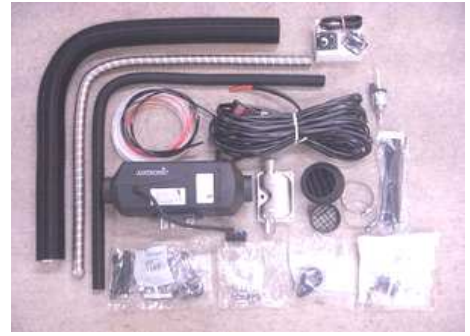
エアトニックD4セット内容

1. マイクロンシールド 2. スターターモーター 3. ヒーターコア 4. エアトニックユニット 5. 断熱空気循環ファン 6. コアファン 7. ガラス繊維モーター 8. スターターモーター 9. 断熱ファン 10. 断熱空気循環ファン 11. フロントモーター 12. 断熱空気入口 13. 断熱空気出口 14. アースライン 15. 断熱空気循環ファン 16. アースライン 17. 断熱空気入口 18. 断熱空気出口 19. 断熱空気出口 20. 断熱空気出口 F. 断熱空気入口 G. 断熱空気出口 H. 断熱空気出口 I. 断熱空気出口 J. 断熱空気出口 K. 断熱空気出口 L. 断熱空気出口 M. 断熱空気出口 N. 断熱空気出口 O. 断熱空気出口 P. 断熱空気出口 Q. 断熱空気出口 R. 断熱空気出口 S. 断熱空気出口 T. 断熱空気出口 U. 断熱空気出口 V. 断熱空気出口 W. 断熱空気出口 X. 断熱空気出口 Y. 断熱空気出口 Z. 断熱空気出口 B1LC compad(12V, ガソリン仕様) D1LC compad(12V, ディーゼル仕様) D1LC compad(24V, ディーゼル仕様)